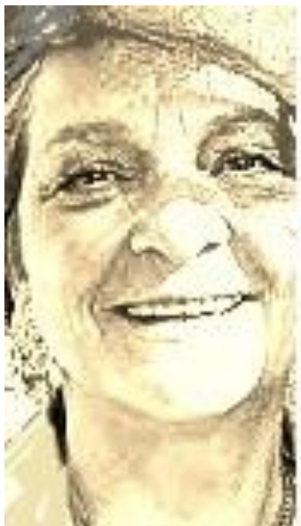
'Mamourine, Source de vie' peinte par Marie Piotrovski

« Nous sommes renvoyés à Saint Joseph ».